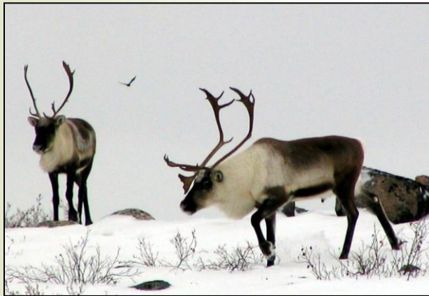
የጥናት ግብ ጥናት

የጥናት ግብ: ደጋጋሚ ጥናት ለማድረግ ይህን ዓይነት ጥረት ያድርጉ።